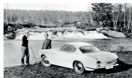
Volvo presenteerde de P1800 graag als vrijetijdsauto – al was hij voor lange vishengels wellicht wat klein.

De carrosserie van het eerste prototype laat Petterson tekenen door de designstudio van de Italiaanse ontwerper Pietro Frua, waar zijn zoon Pelle werkt. Omdat Volvo daarvoor zelf de capaciteit niet heeft, wordt de bouw van de