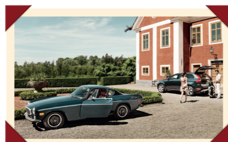
Een Amerikaanse P1800 van de laatste modeljaren, in goed gezelschap van een moderne SUV.

volgens anderen voor Sport, maakt de kwalitatief flink verbeterde P1800 een nieuwe start. De nieuwe Zweedse versie is uiterlijk herkenbaar aan de gewijzigde bumpers en wordt in de jaren daarna regelmatig verder gemoderniseerd. In 1972 wordt de productie beëindigd.