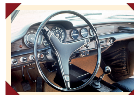
Tijdens de lange loopbaan van de P1800 verandert het dashboard nauwelijks.

Volvo-directie opnieuw in Duitsland op zoek gaat. Er wordt gesproken met kleine fabrikanten als NSU, Drauz en Hanomag, maar geen van deze bedrijven kan voldoen aan de hoge kwaliteitseisen van de Zweden, die beducht zijn voor een herhaling van het echec met de kleine roadster P1900.