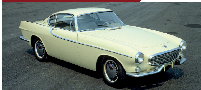
De bij Jensen gebouwde P1800's zijn herkenbaar aan de gedeelde bumpers.

In 1960 begint de productie voor modeljaar 1961. In kosmopolitische kringen wordt de nieuwe kleine Volvo al snel als het nieuwe hebbeding omarmt. Een hoofdrol in de nieuwe televisieserie 'The Saint', die Volvo min of meer in de schoot geworpen kreeg omdat Jaguar de beoogde auto's niet op tijd voor de opnames kon leveren, versterkt het modieuze imago van de P1800. De combinatie van frivole Italiaanse vormgeving met degelijke Zweedse techniek blijkt een geslaagde cocktail. Dat de B18-motor uit de Amazon niet bepaald uitblinkt in sportieve prestaties, daar maakt de trendy, en niet zelden vrouwelijke clientèle niet om.