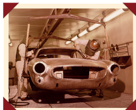
Na de verhuizing van de productielijn naar Zweden heeft Volvo de kwaliteitsproblemen snel onder controle.