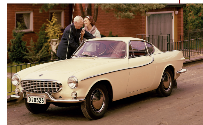
De P1800 is een kleine chique coupé.

Volvo gaat dus op zoek naar een andere partner voor de bouw van de P1800. Het merk heeft grootse plannen met het model, met name voor de Verenigde Staten waar kleine Europese coupés op dat moment erg in de mode zijn. Frua, dat verantwoordelijk is voor het design, valt bij gebrek aan voldoende productiecapaciteit snel af, waarna de