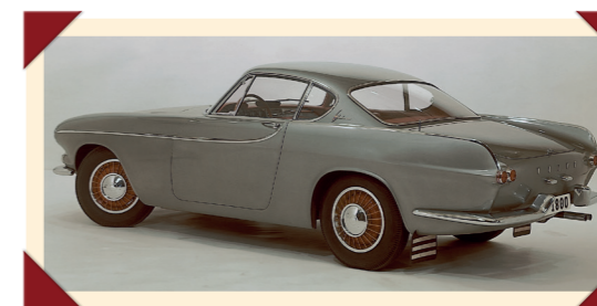
Sportieve styling voor een beschaafde coupé.

Uiteindelijk leidt de zoektocht naar Engeland, waar sportwagenbouwer Jensen ambitieuze uitbreidingsplannen heeft en bereid is de strenge voorwaarden van Volvo te accepteren. De samenwerking wordt bezegeld met een contract dat voorziet in de productie van 10.000 auto's.